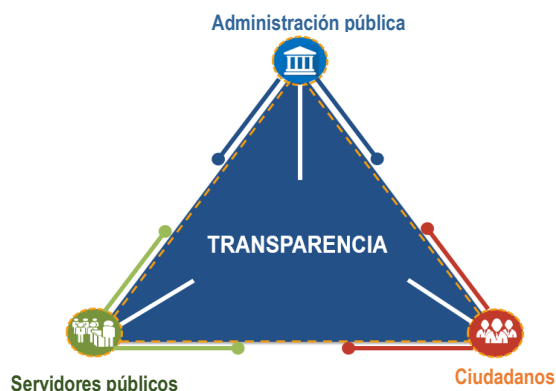
Grafico 1. Fuente. Triángulo de la Integridad. MIPG. 2019

“La integridad se constituye en un elemento central de la construcción de capital social y de generación de confianza de la ciudadanía en el Estado. La integridad es una característica personal, que en el sector público también se refiere al cumplimiento de la promesa que cada servidor le hace al Estado y a la ciudadanía de ejercer a cabalidad su labor. (MIPG, 2017)”